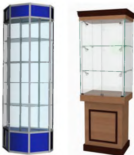
Примерный вариант: Витрина экспозиционная